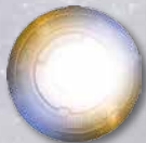
SWINDLER TOKEN FRONT