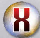
MARK TOKEN FRONT