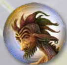
SWINDLER TOKEN BACK

These tokens are only used when playing with the Swindler alien. Six of these tokens are blank and one is marked with an "X" on its front to indicate which player is the Swindler's "mark." Their use is completely described on the Swindler alien sheet.